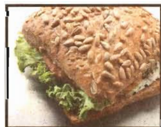
Sandwiches sind okay. Walter Pfaffli

Das Sandwich ist der Klassiker für den kurzen Mittag. Doch Einklemmtes ist nicht gleich Einklemmtes. Zu empfehlen sind Vollkornbrote, da sie viele Ballaststoffe enthalten. Die Fasern quellen im Magen auf und führen so zu einem verlängertem Sättigungsgefühl. Zudem schützen sie vor Verstopfung, allerdings nur, wenn man gleichzeitig genügend trinkt. Denn die Fasern brauchen Flüssigkeit zum Quellen. Auch im Inhalt gibt es grosse Unter-