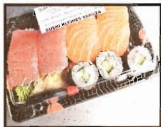
Sushi liegt nicht auf. Walter Pfaffli

Fisch – insbesondere roher Lachs – enthält viele Omega-3-Fettsäuren. Sie schützen vor Herz-Kreislauf-Erkrankungen, senken den Blutdruck und hemmen Entzündungen. Fisch liefert auch hochwertige Eiweisse und ist sehr fettarm. Wasabi, das scharfe Grün, das zum Sushi gereicht wird, regt das Immunsystem an und putzt die Schleimhäute durch. Die nötigen Kohlenhydrate sind im Reis enthalten. Sushi ist leicht und liegt nicht auf, daher ist es für