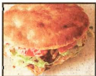
Kebab kann gesund sein.

Einst bestand das Kebab aus aufgespiessten Fleischstücken und war eigentlich eine sehr gesunde Speise. Leider findet man diese Form nur mehr selten. Die moderne und günstigere Variante ist eine Riesenwurst, die viel Brät zum Binden enthält und daher fetthaltiger ist als die herkömmliche. Wer gerne Döner isst, sollte um etwas weniger Fleisch und dafür mehr Salat bitten und Joghurt- anstatt Cocktailsauce bestellen. Scharf ist zu empfehlen, da es das Im-